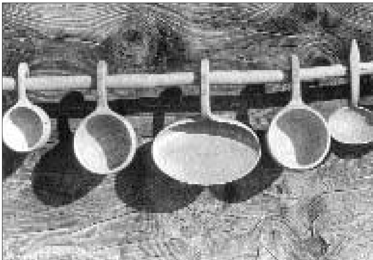
L'experientscha da blers tschientaners ha furnà il design da las sgrameras e paluttas.