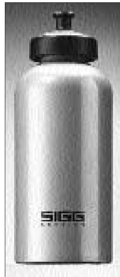
La butteglia da sigg è in exempel classica dad ozildi.